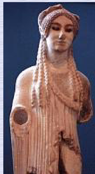
La conocidísima Koré nº 674, conocida por los arqueólogos como «koré pensativa» o «koré de ojos almendrados». Verdadera joya del período arcaico.

(Anacreónticas, frag. 24 Bergk) (Trad. de Andrés Pociña)